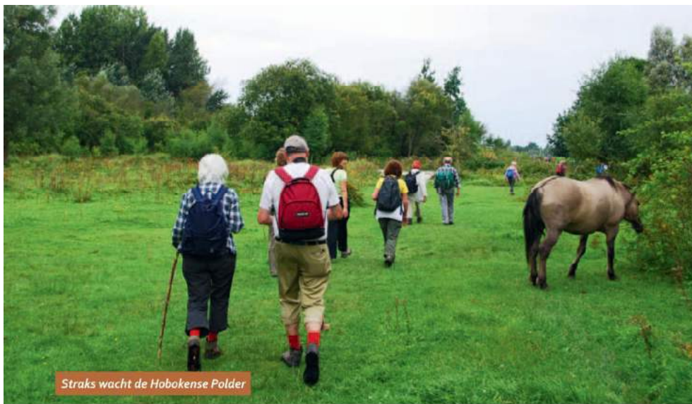
Straks wacht de Hobokense Polder

Je ziet nu de wit-rode tekens van de GR E2-verbindingroute. Je komt uit in de bocht van een straat (Meetjeslandstraat). In dezelfde richting lopend kom je enkele meters verder op een T-kruising. Rechtsaf en onmiddellijk linksaf in de Atlasstraat. Op het einde ga je links in de J. Pauwelslei en aan de volgende splitsing rechts in de Voorzorgstraat voorbij rust- en verzorgingstehuis De Hoge Beuken. Net voor de spoorweg rechtsaf op het fietspad en meteen oversteken langs de voetgangersbrug. Aan de andere kant wandel je verder over de parking van een bedrijf waar je op het einde de toegang vindt van het Natuurpuntreservaat De Hobokense Polder 5.