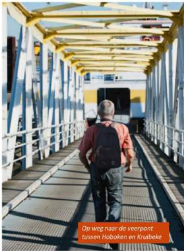
Op weg naar de veerpont tussen Hoboken en Kruike