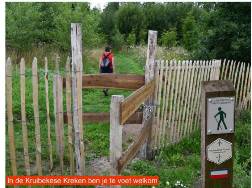
In de Kruikeke Kreken ben je te voet welkom