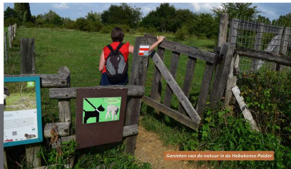
Genieten van de natuur in de Hobokense Polder