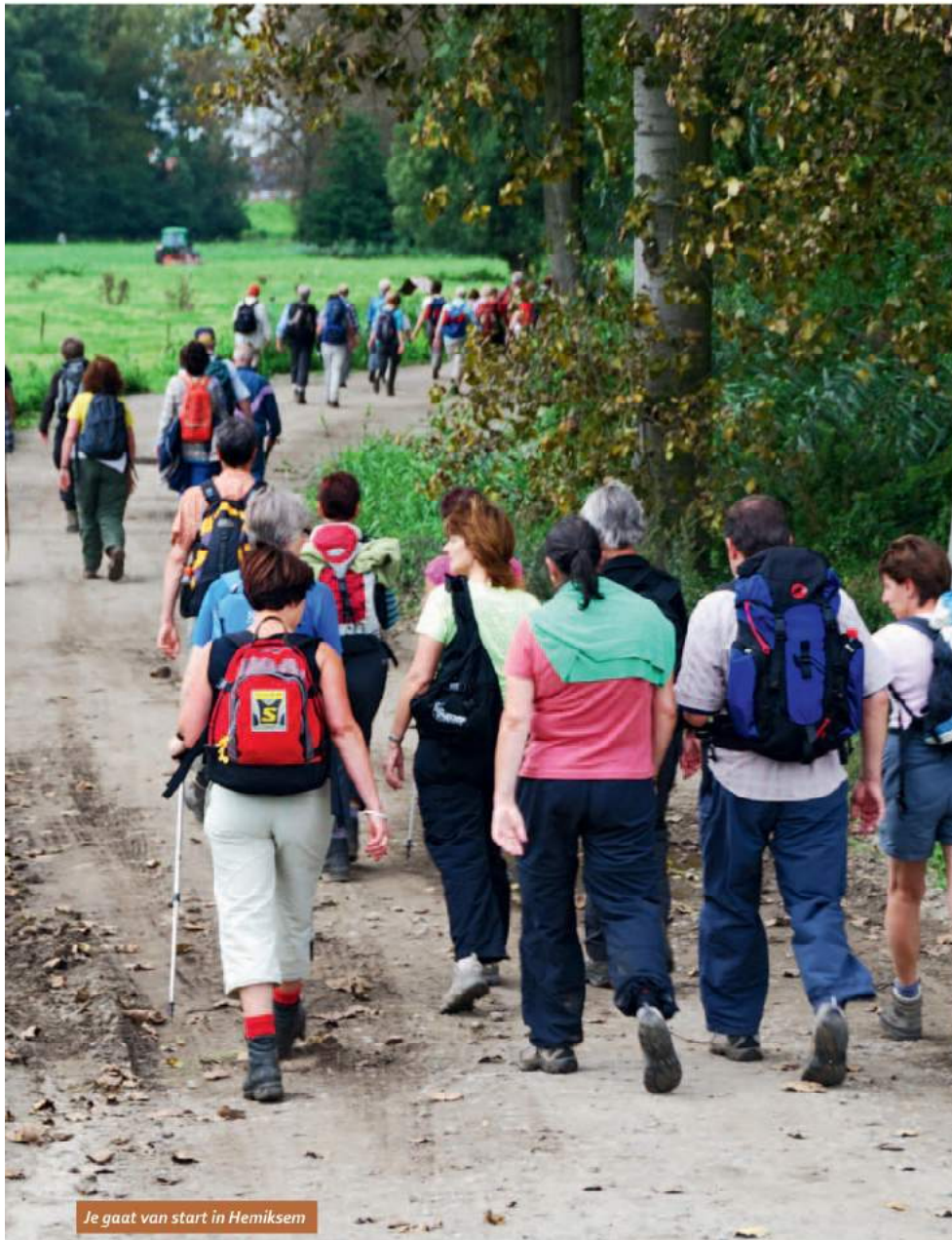
Je gaat van start in Hemiksem