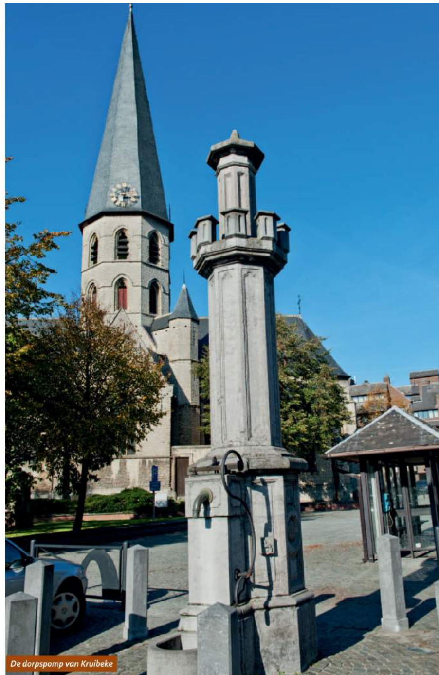
De dorpspomp van Kruibeke

O.-L.-Vrouwplein, 9150 Kruibeke · tel. 03 740 02 10