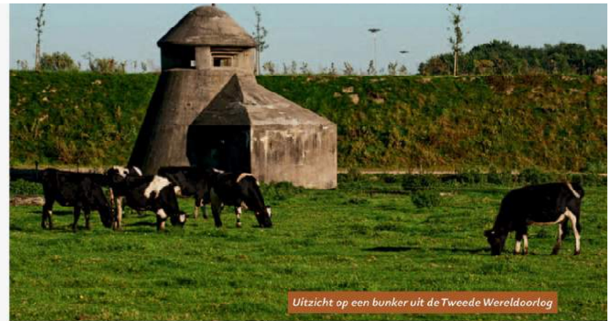
Uitzicht op een bunker uit de Tweede Wereldoorlog

de vijver verder te volgen. Het gaat door wat bosjes. Je komt uit tegenover het rood geverfde kasteel Zorgvliet ③.