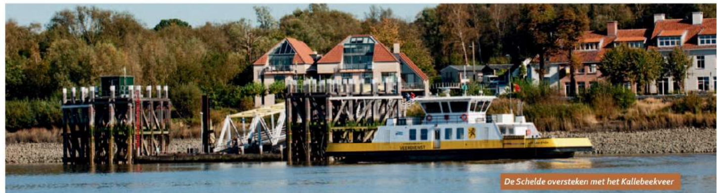
De Schelde oversteken met het Kallebeekveer

Met die kasseiweg achter de rug, hier Zandcamp genaamd, ga je linksaf langs de voormalige scheepswerven van Cockerill (Bombekelaan). De tweede straat rechts is de Maccabilaan en op het einde daarvan, voor een rij appartementsgebouwen, ga je rechtsaf in de Lenaart de Landrestraat, richting Moretusbrug. 500 m verder bereik je de (gratis) overzet van Hoboken naar Kruibeke 7. Het veer vertrekt om het halfuur, van 5 u tot 22 u, elke dag (behalve bij uitzonderlijk slecht weer). Tussen 12 u en 13 u neemt de veerman een pauze.