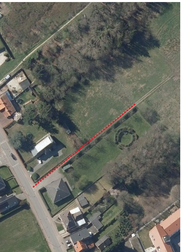
Luchtfoto 2020 met aanduiding van de bedoelde wegenis