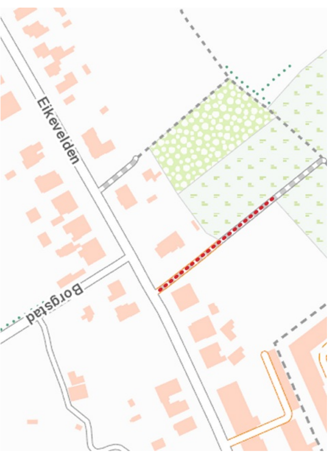
Cartoweb - NGI: detailkaart met aanduiding van de bedoelde wegenis